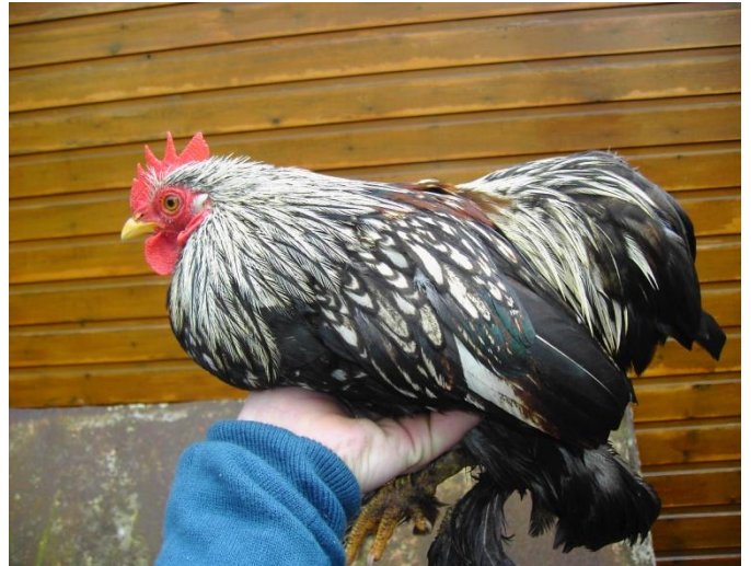
Cochin kriel Zilver Zwartgezoomd (haan)