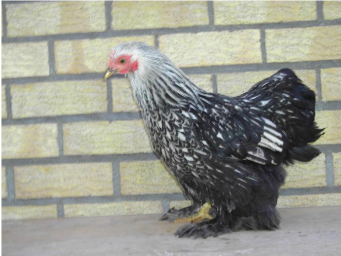
Cochin Kriel Zilver Zwartgezoomd (hen)

Hieronder kan je het verschil zien tussen een volwassen hen en haan.