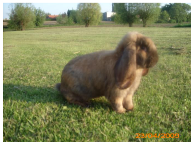
Franse hangoor madagaskar

De voorkeur gaat vaak naar dwergkonijnen. Dit is omdat je ze dan beter kan hanteren en omdat ze minder plaats nodig hebben. Mensen die veel plaats hebben, kunnen overwegen om een groot konijn te nemen. Deze zijn vaak veel rustiger en hebben een aangenaam karakter.